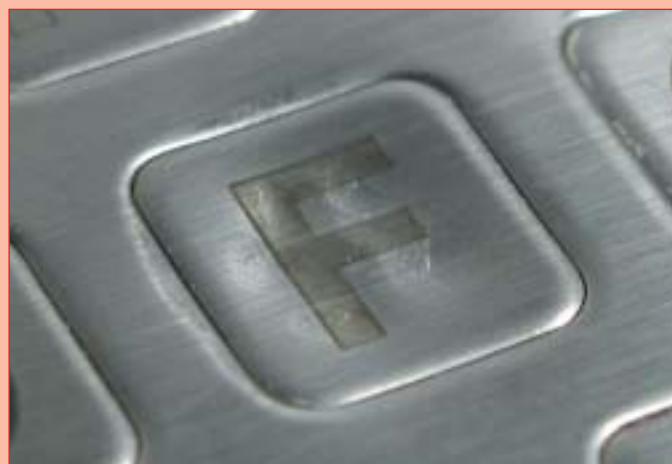
Betätiger einer Metalltastatur nach Prüfungsdurchführung